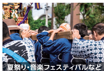
夏祭り・音楽フェスティバルなど