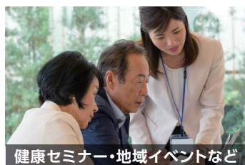
健康セミナー・地域イベントなど