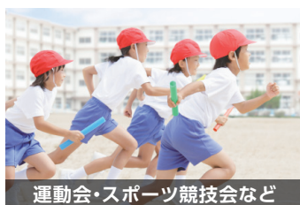
運動会・スポーツ競技会など